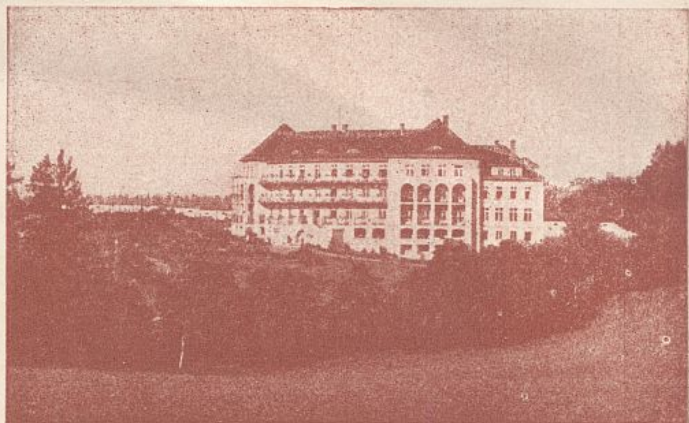
Sanatorium „Marschall Piłsudski“.